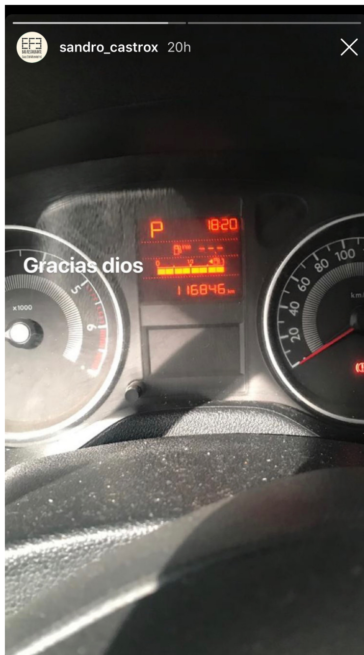
Captura de pantalla

Así quedó evidenciado en una historia que el propio Castro publicó en su red social Instagram, en la que se ve la pizarra del carro donde aparece el medidor de combustible, lleno, y las palabras “Gracias Dios”.