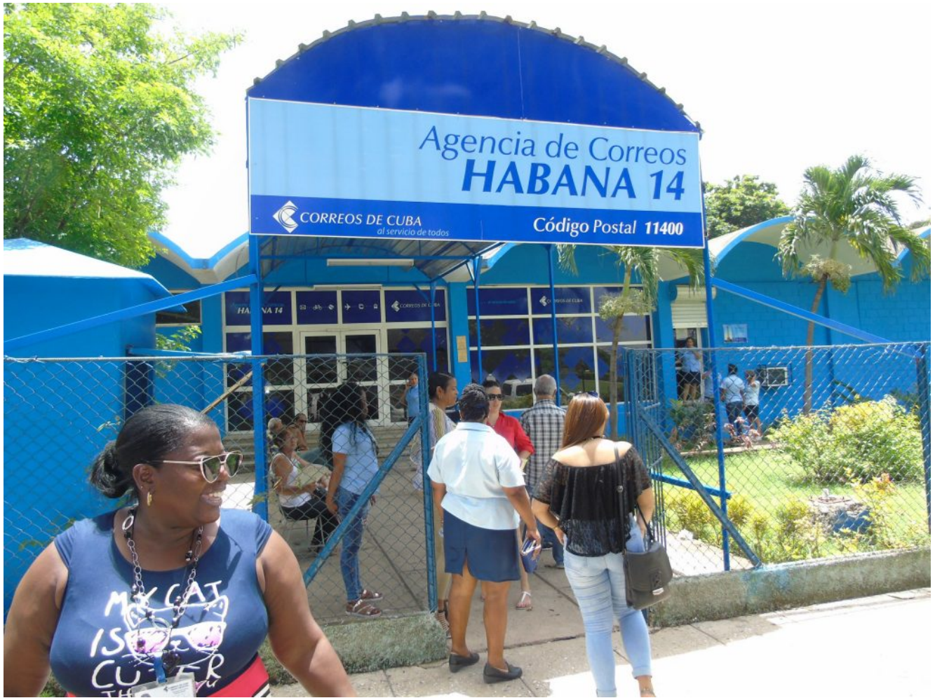
Oficina de Correos de Cuba

MIAMI, Estados Unidos.- Desde este lunes 13 de abril el servicio de Correos de Cuba implementará una prueba piloto que consiste en entregar compras online, con el objetivo de favorecer las medidas de aislamiento social en la Isla, informó la Agencia Cubana de Noticias (ACN).