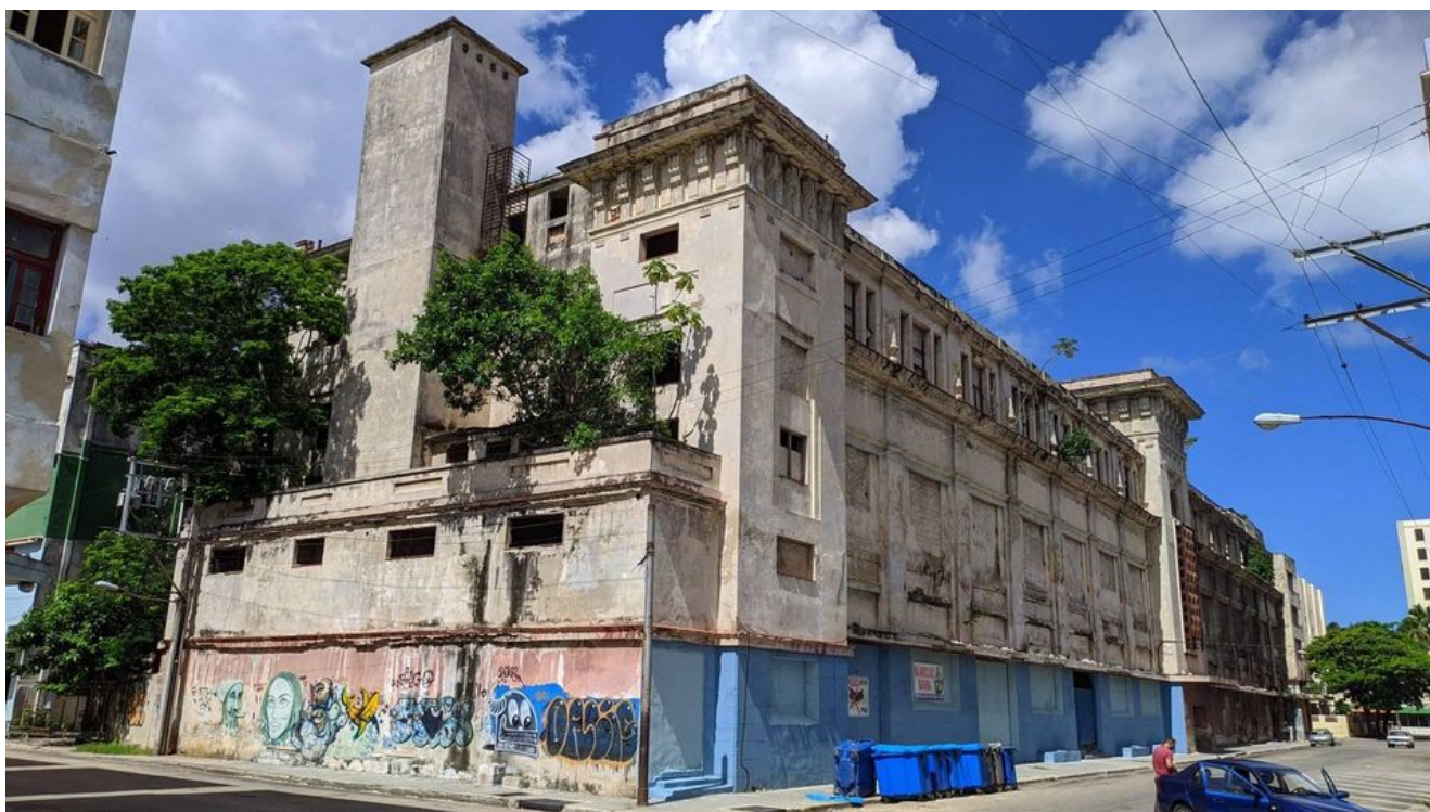
El edificio que GAESA reclama

“Nadie (en GAESA) sabía que se había iniciado el movimiento de tierra, nadie notificó de la asignación de esa parcela, es una zona súper especial y el GAE tiene prioridad. (...) Es norma que se notifique al GAE y si nosotros no estamos interesados entonces le corresponde al MINTUR, y en última instancia al Gobierno Municipal, tomar una decisión, porque es una parcela de alto interés para las inversiones, pero siempre previa consulta con el GAE”, afirma el funcionario y abunda sobre la alarma y el malestar generados al interior del monopolio empresarial militar, que en estos momentos reclama derechos sobre la parcela.