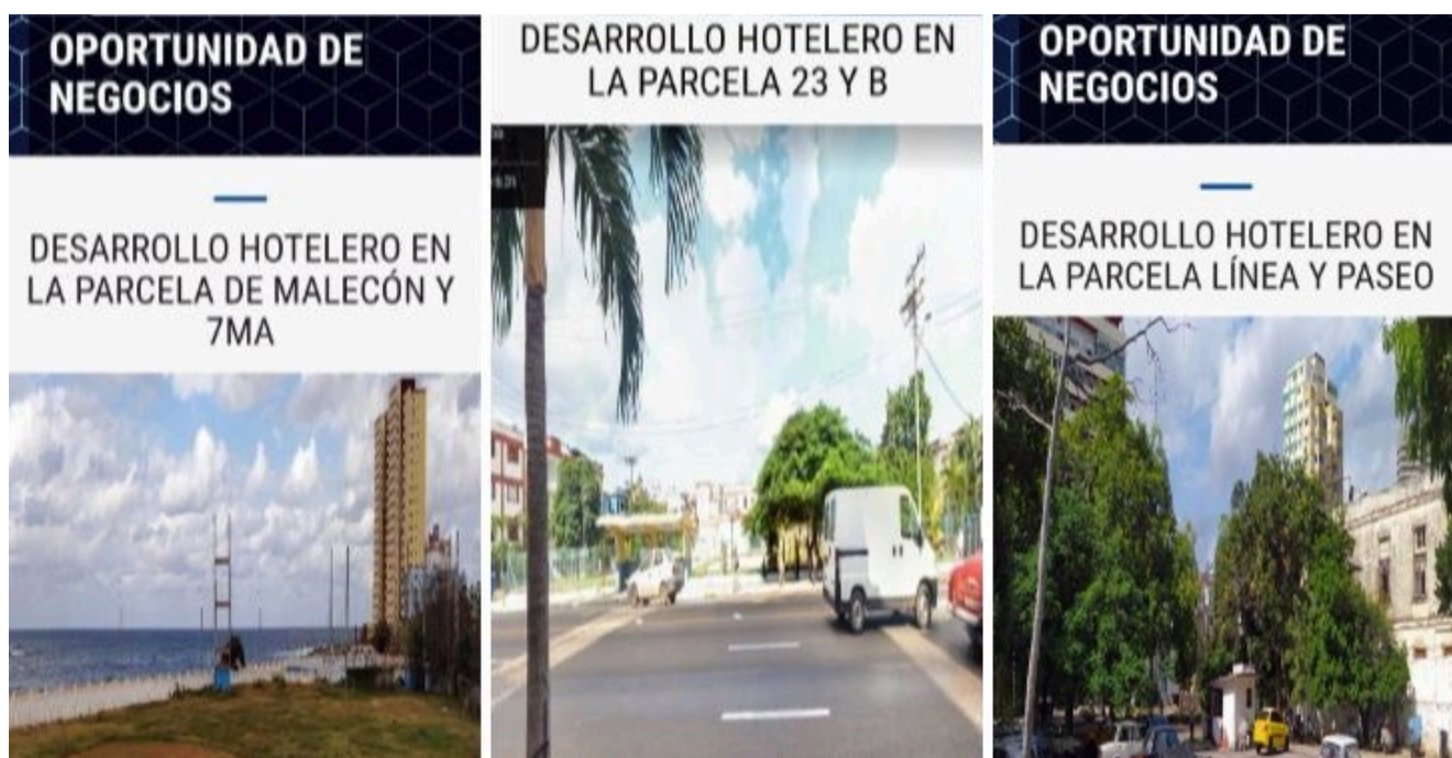
Promoción de las parcelas de Malecón y 7ma., 23 y B, y Línea y Paseo, en la Cartera de Oportunidades 2022 (Capturas de pantalla)

No obstante, el Ministerio de Turismo aspira , con la perspectiva de recibir más de 6 millones de visitantes, a superar las 100 000 habitaciones para el año 2030, la mayoría (y las mejores) construidas por GAESA, con proyectos (entre alojamientos y extrahoteleros) que, en conjunto, superarían ampliamente los 1 000 millones de dólares de inversión, tal como se anuncian algunos en la más reciente Cartera de Oportunidades.