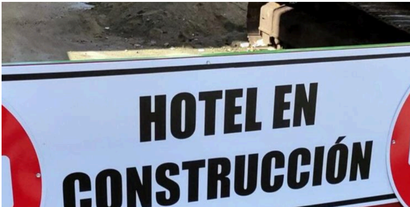
Valla que indica el cierre de la calle

Luego de la nota citada, la prensa oficialista no ha vuelto a tocar el tema, a pesar de que nada se aclara al respecto de unas obras que han despertado la curiosidad no solo de quienes transitan por el lugar sino de las propias brigadas que laboran allí. Incluso, estando las obras emplazadas frente a los estudios de un canal de televisión (Canal Educativo), no aparece aún el primer reportaje donde se abunde en detalles sobre lo que habrá de ser lo que, en momentos de esplendor fuera el famosísimo cabaret Montmartre y, más tarde, con la sovietización emprendida por el castrismo a partir de los años 60, el restaurante Moscú, desaparecido en un misterioso incendio a mediados de 1989 (una fecha que coincidía con el colapso de la Unión Soviética).