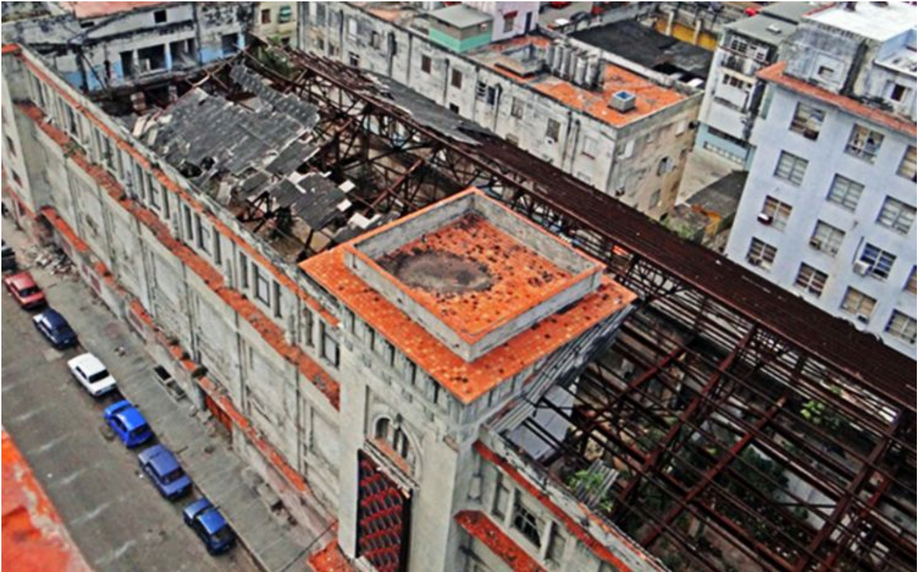
Vista área de las ruinas del restaurante Moscú

Sin embargo, otras fuentes aseguran que la parcela está siendo reclamada para un pequeño hotel de ciudad, administrado por la empresa francesa Accor, y cuyo propietario sería la constructora militar Alмест S.A., perteneciente a GAESA.