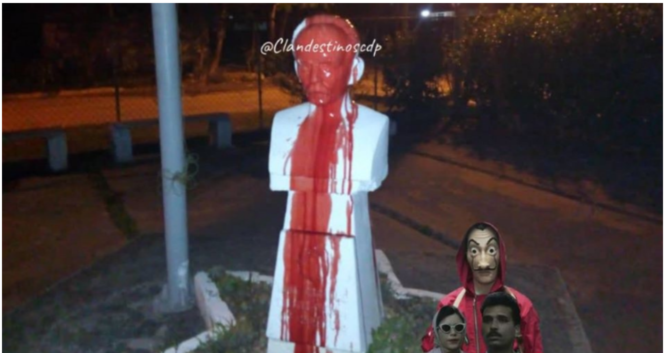
Busto de José Martí

LA HABANA, Cuba. - La prensa escrita cubana no ha brindado una cobertura explícita a la acción que culminó en el vertimiento de pintura roja sobre un busto