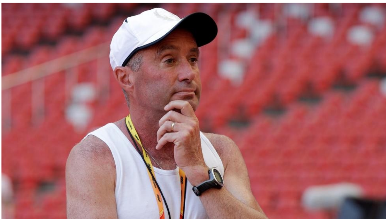
Alberto Salazar

COLORADO, Estados Unidos. - El entrenador de atletismo, Alberto Salazar, quien