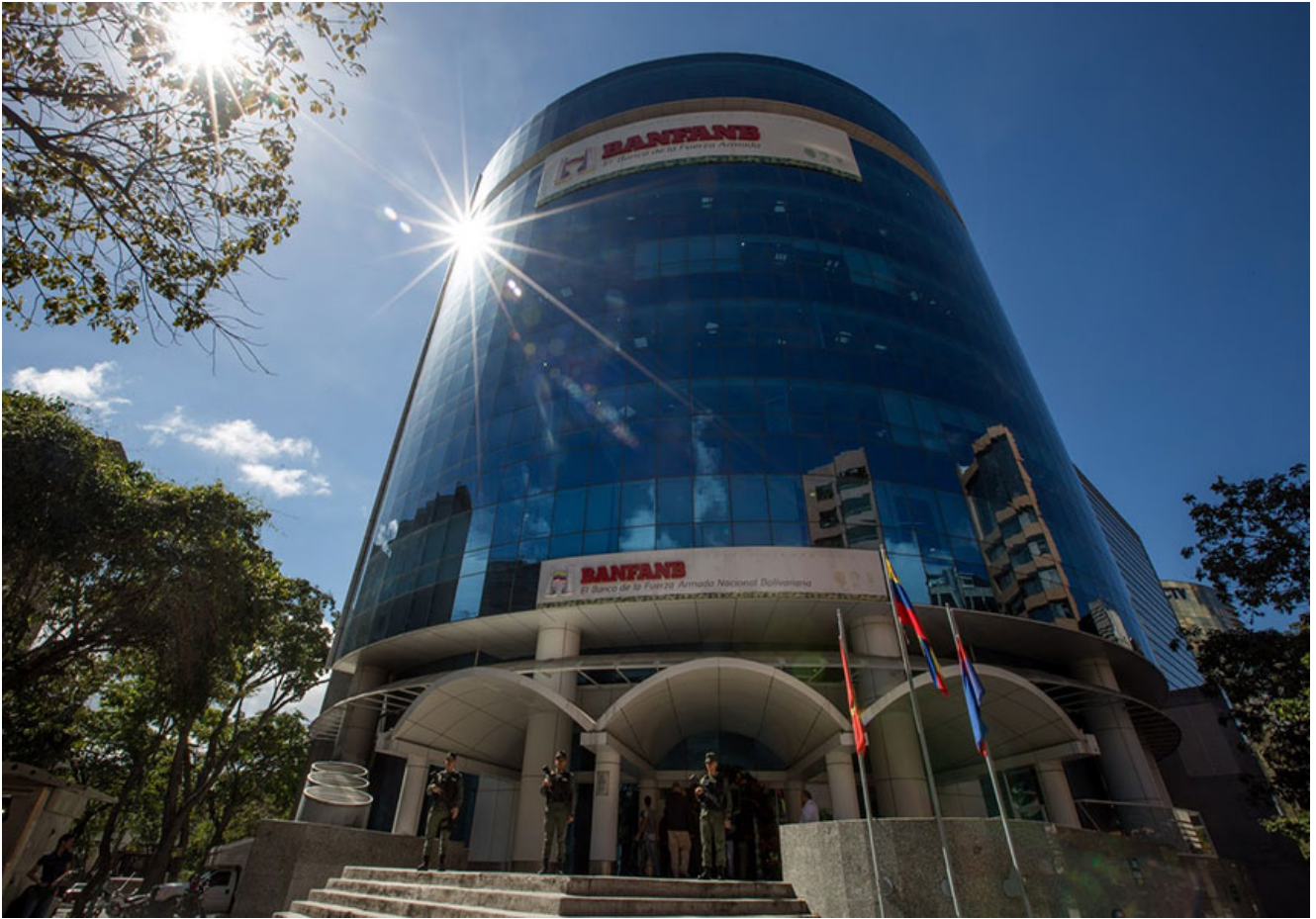
Sede del Banco de la Fuerza Armada

MIAMI, Estados Unidos. – La compañía distribuidora de tarjetas de crédito y débito, Mastercard, suspendió sus servicios y contratos de licencia al Banco de las Fuerzas Armadas (BANFANB) y el Banco Agrícola de Venezuela, informaron medios del país suramericano.