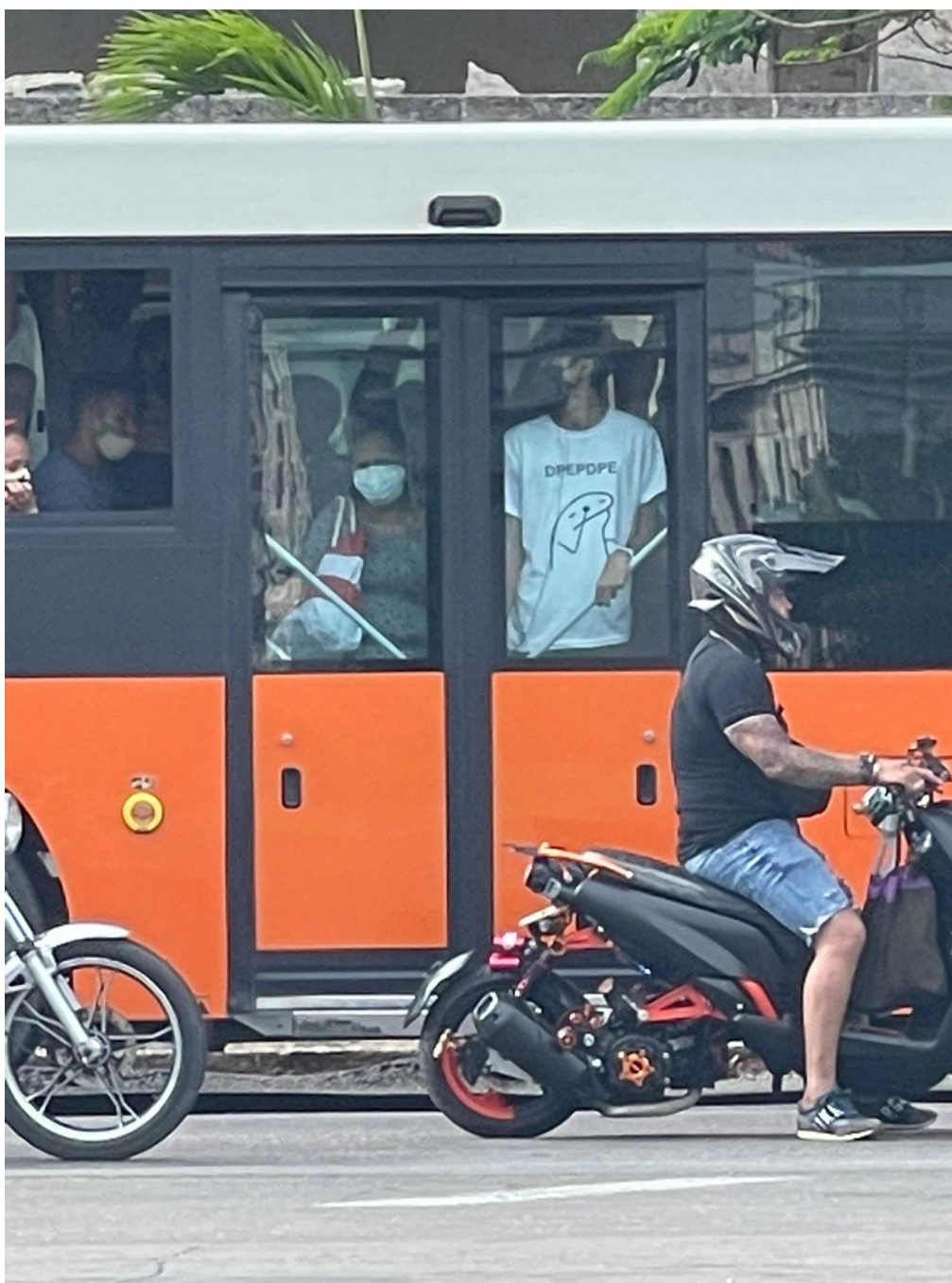
Otro joven cubano usa una camiseta con el “DPEPDPE” en el transporte público

“No hay dinero para comprar medicamentos o para ayudar a los pensionados que lo que les pagan no les da para llegar aunque sea a los primeros 10 días del mes. Pero para comprar y hacer carteles y propagandas para el 1ro. [de Mayo] sí aparece dinero. DPEPDPE”, escribió el usuario identificado como Ronin.