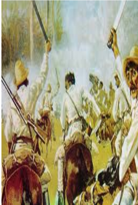
(Tomado del artículo del mismo nombre de Abel sierra madero)

(...) Es paradójico observar cómo en esta isla, que ha tenido un pasado histórico propicio para que, en determinadas épocas, aflore la homosexualidad, no se han producido -hasta hace muy pocos años- muchos discursos sobre este tema.