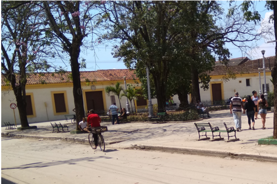
Parque wifi

“Otra cosa que noté es que el navegador Firefox ha dejado de funcionar para loguearnos con nuestras cuentas nauta. He tenido que utilizar el internet Explorer o el Google Chrome”, añadió Lázaro.