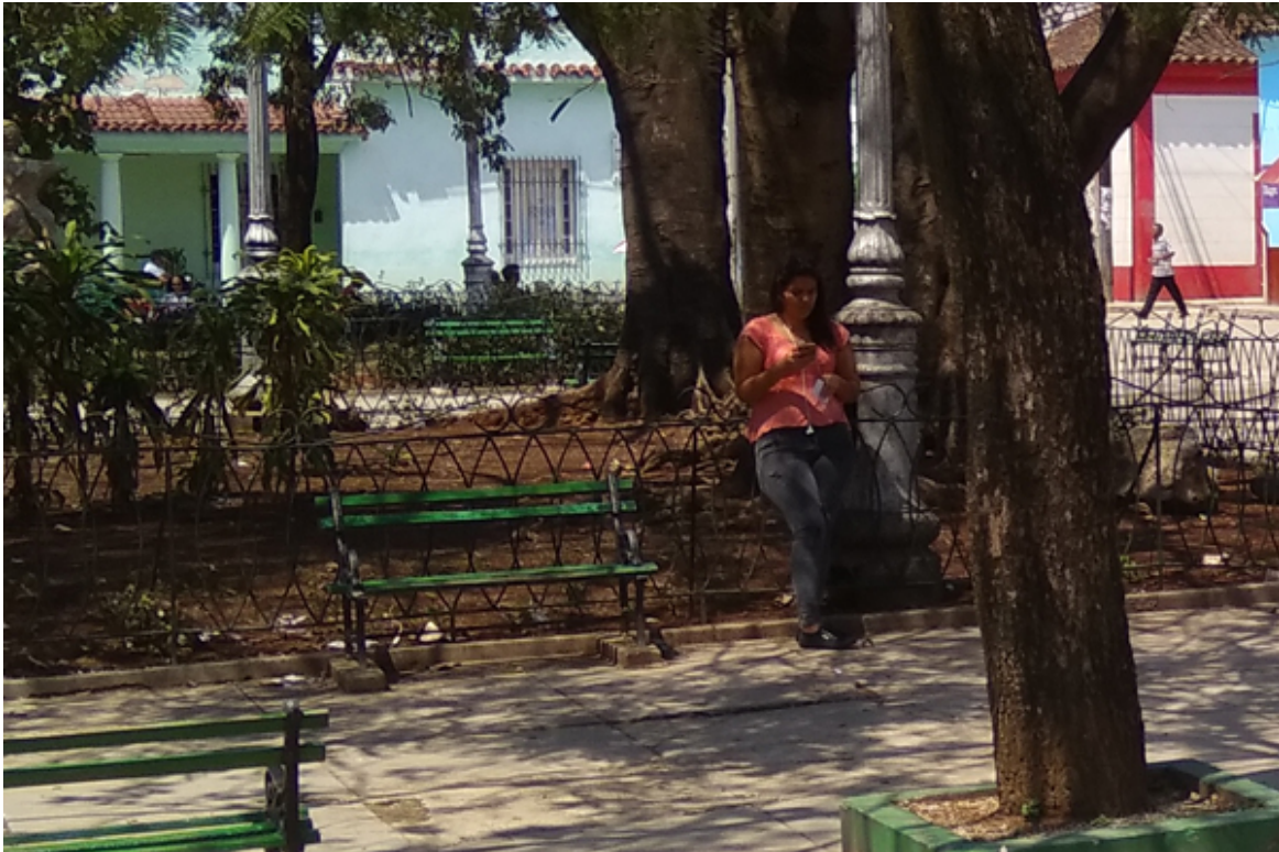
Joven usuaria en un parque wifi intentando conectarse

LA HABANA, Cuba.- El pasado viernes 21 de abril la Empresa de Telecomunicaciones de Cuba (ETECSA) anunció que interrumpiría los servicios de navegación en zonas wifi y para la red Enet por cuestiones de mantenimiento.