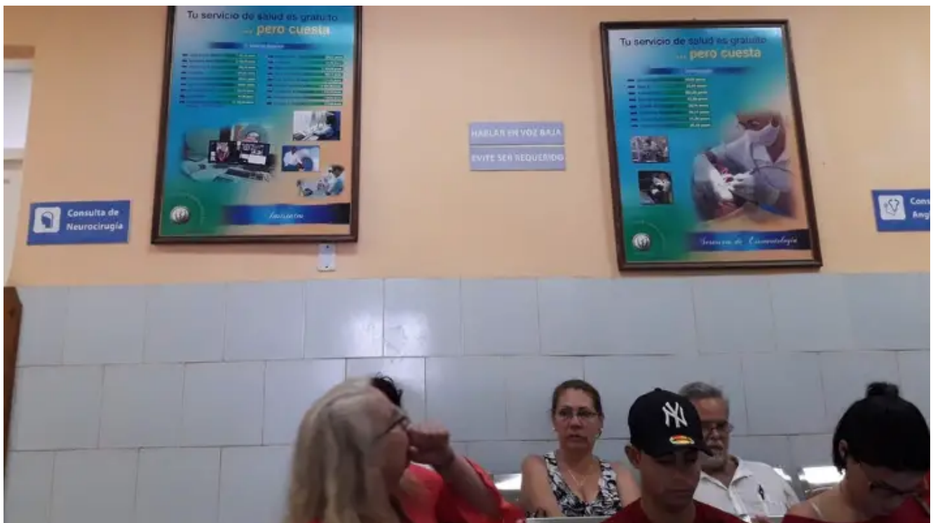
Pacientes en una sala de espera en un hospital

LA HABANA, Cuba.- El pasado domingo, un vecino de mi edificio me contrató para que lo llevara en mi carro a un hospital ortopédico. El día anterior, al saltar