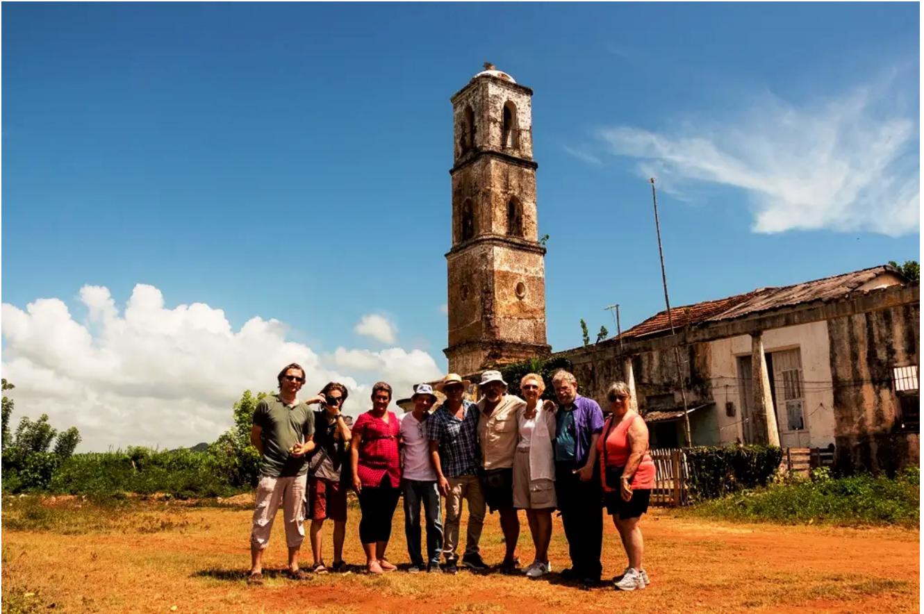
Equipo de rodaje en la Torre de Caibarién