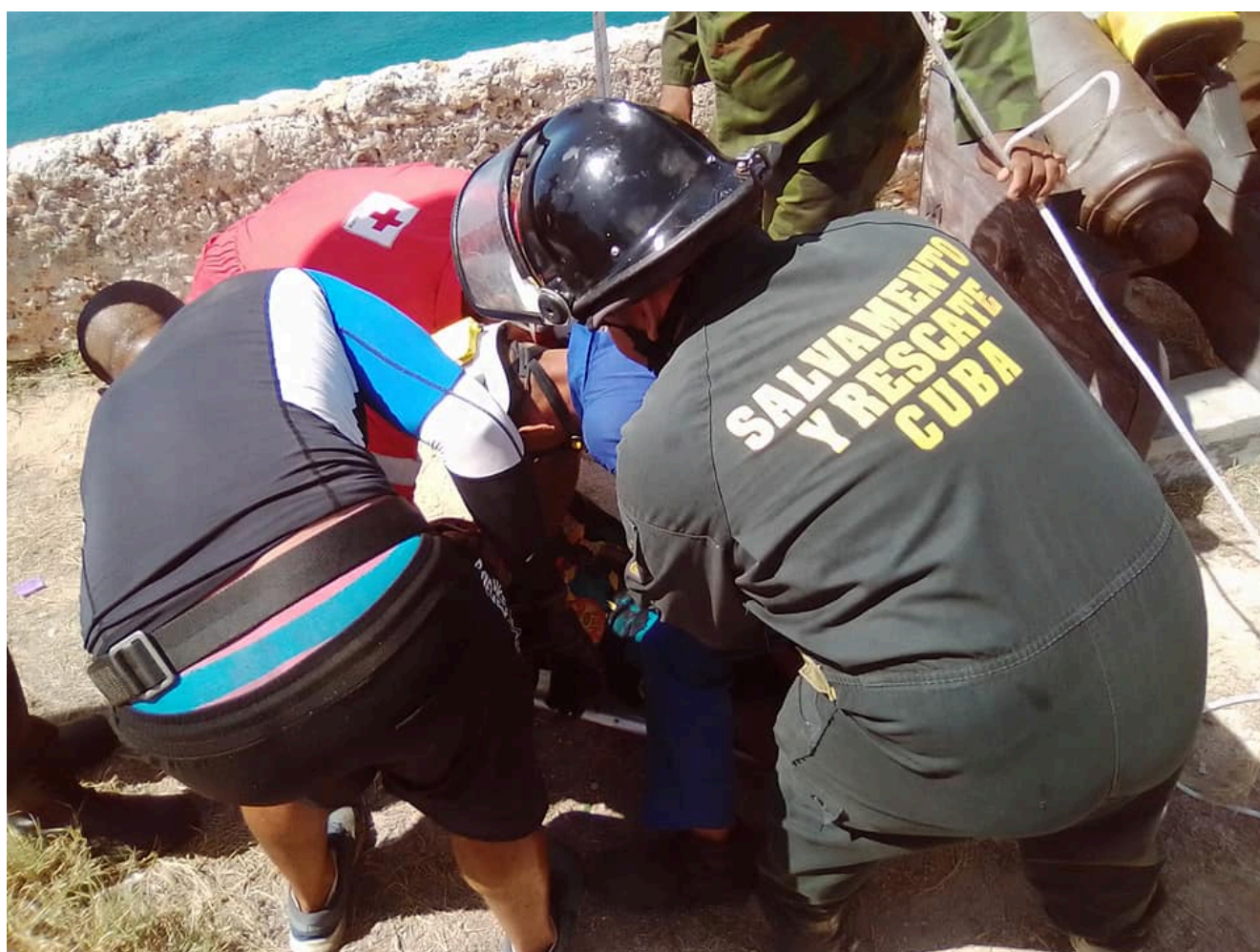
Labores de rescate y salvamento

También precisó que vecinos y familiares del ciudadano confirmaron que se trató “con toda seguridad” de un acto de suicidio, ya que el joven de 37 años está diagnosticado con esquizofrenia paranoide.