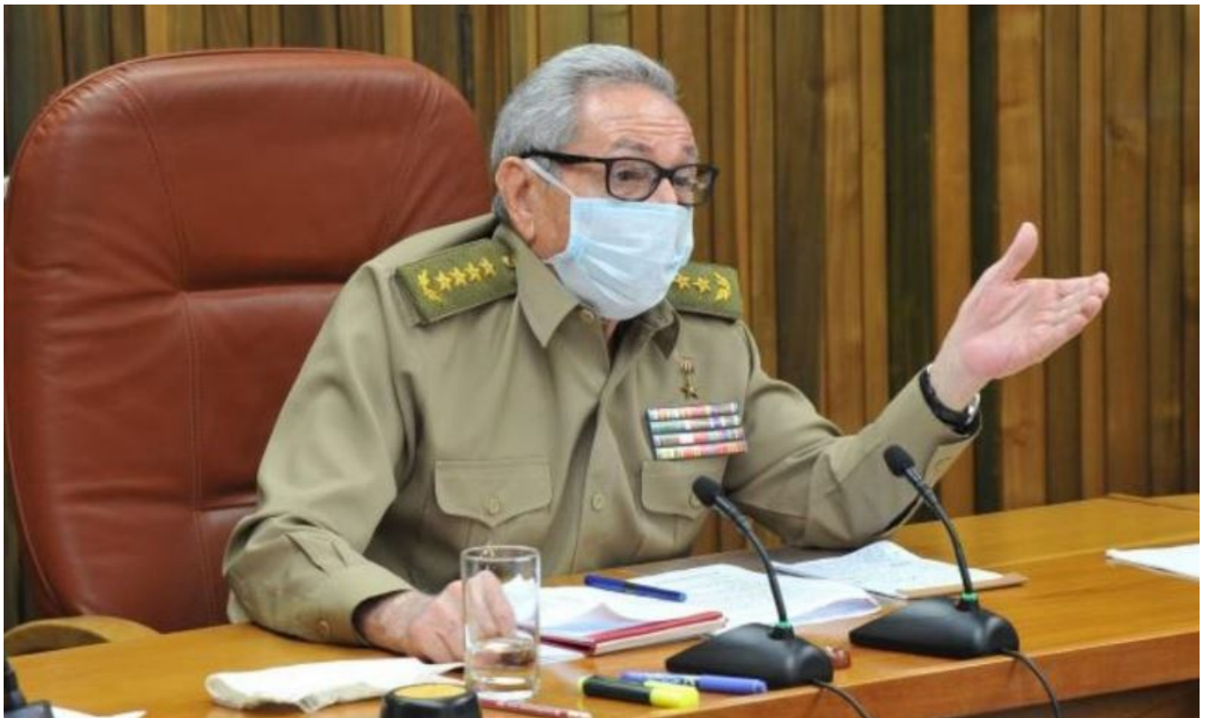
Raúl Castro