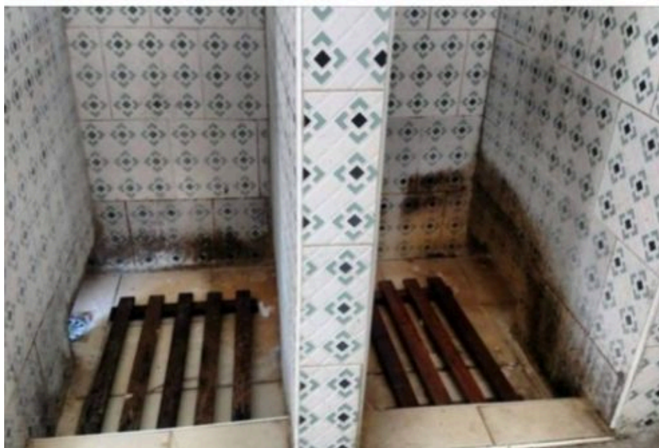
Captura de pantalla

White, que trabaja en la emisora Radio Surco y Televisión avileña, compartió junto a su publicación imágenes de las condiciones del baño, las duchas y las puertas rotas del centro de aislamiento.