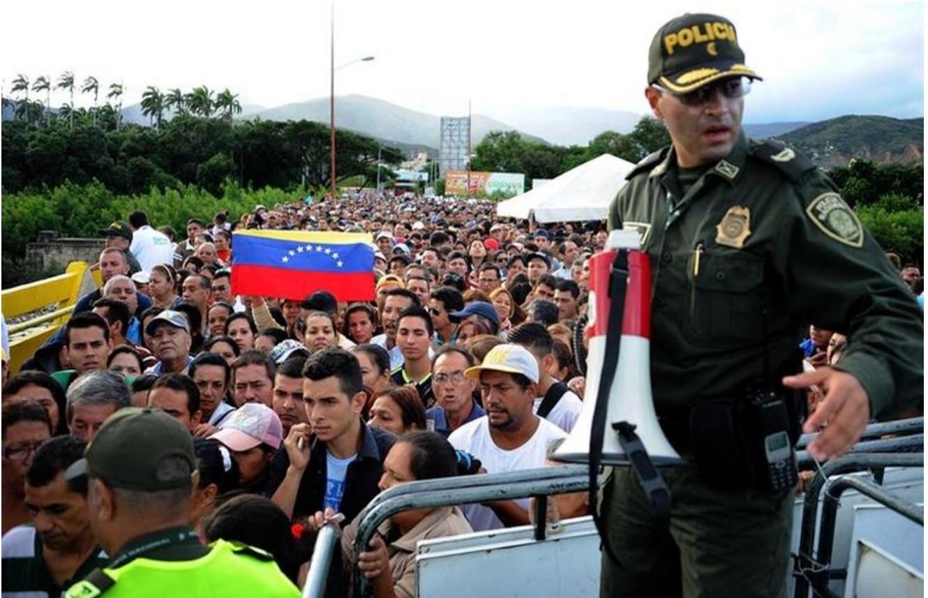
Venezolanos cruzando hacia Colombia por Cúcuta.

MIAMI, Estados Unidos.- A pesar de que los requisitos para emigrar se han recrudecido cada vez más para los venezolanos, según un informe de la firma Consultores 21, el 44% de los ciudadanos de ese país ansía emigrar, informó este lunes Diario de las Américas (DLA).