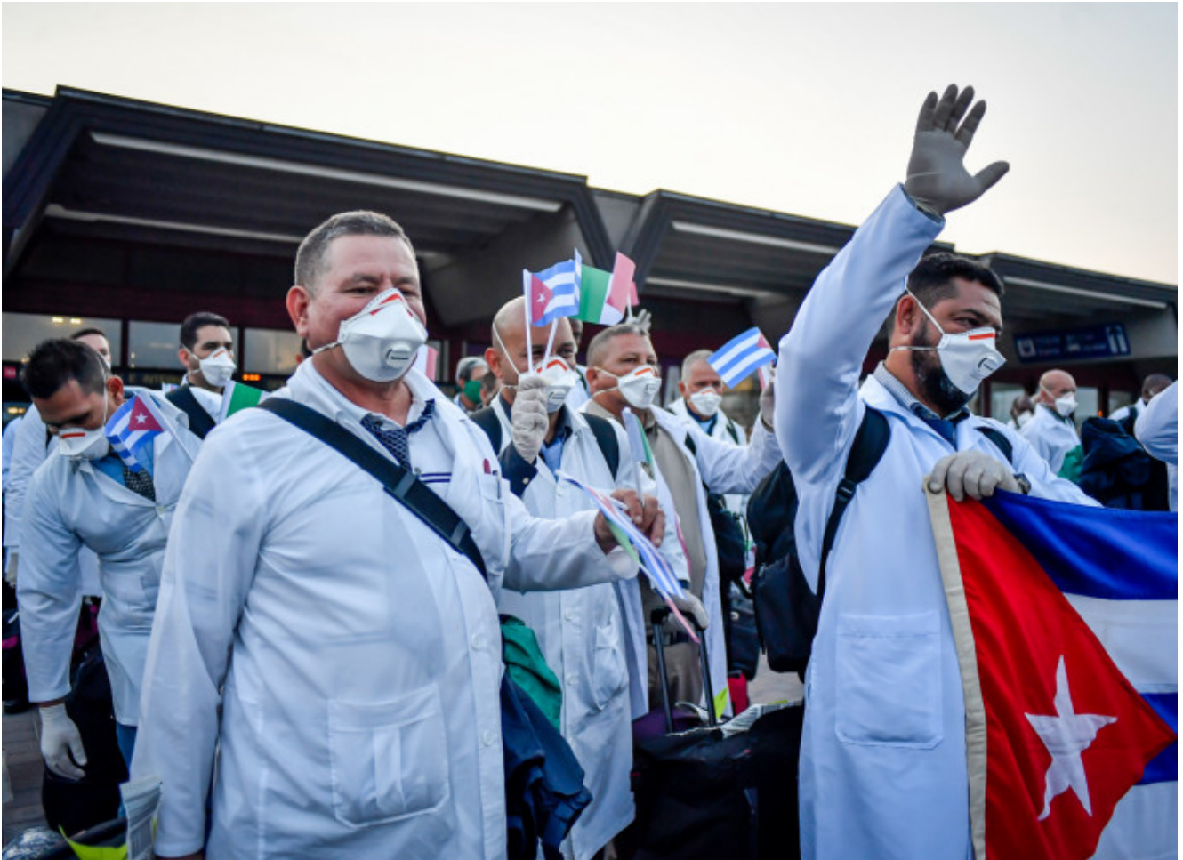
Médicos cubanos

MIAMI, Estados Unidos.- La Encargada de Negocios de la Embajada de Estados Unidos en Cuba, Mara Tekach, denunció este jueves a través de Twitter que la exportación de médicos cubanos para obtener beneficios de su trabajo viola las normas laborales internacionales, en referencia a la posibilidad de que la Isla envíe 200 profesionales de la salud a Argentina.