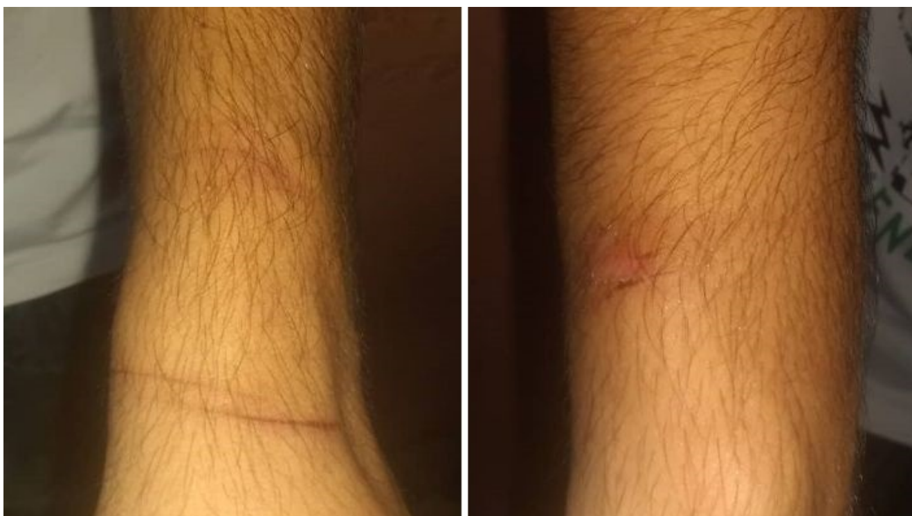
Marcas provocadas por los golpes

“El oficial que estaba de guardia en el calabozo se negó a recibirme en mis condiciones físicas; dijo que necesitaba un certificado médico. Yo estaba lleno de sangre e hinchado por los golpes, pero hicieron una llamada a algún jefe y ese dio la orden de que tenían que encerrarme porque yo era un contrarrevolucionario”.