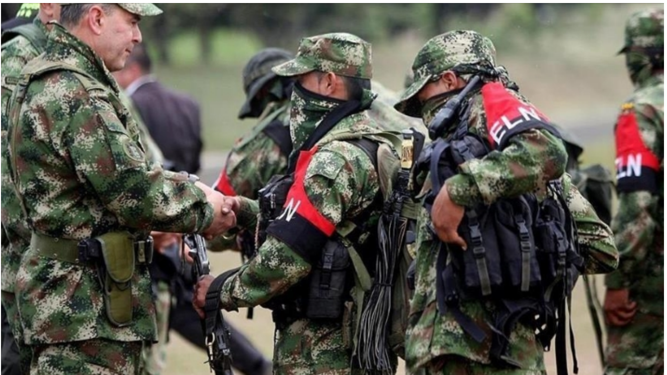
Ejército de Liberación Nacional de Colombia