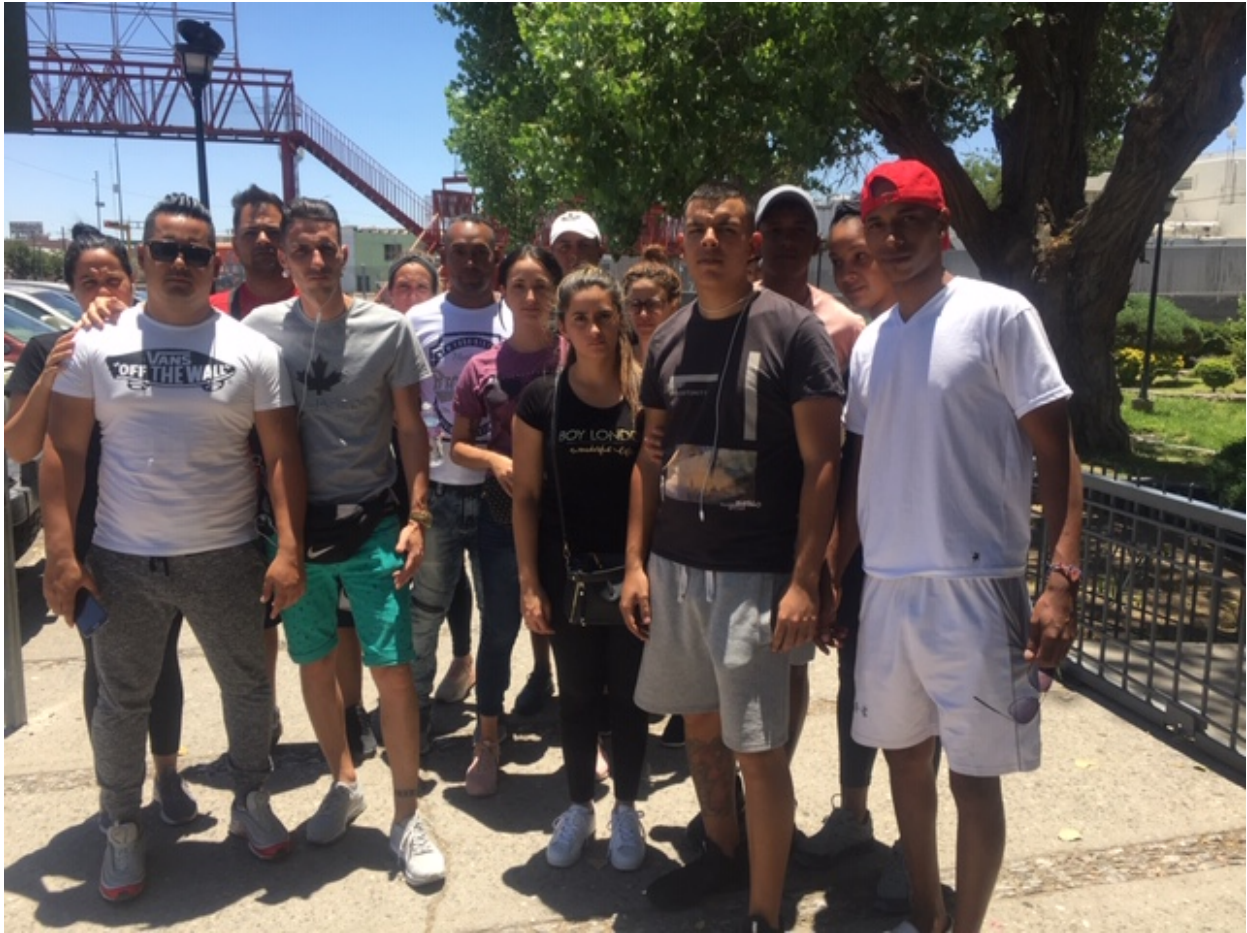
Migrantes cubanos en Ciudad Juárez.

GUATEMALA. - Mauricio Claver-Carone, asesor especial del presidente de Estados Unidos, Donald Trump, y director superior de la división de Asuntos del Hemisferio Occidental del Consejo de Seguridad Nacional, advirtió este jueves que ya no se podrán usar “los agujeros” de la ley de asilo político para fomentar la migración irregular.