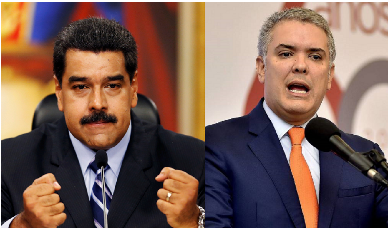
Nicolás Maduro e Iván Duque.