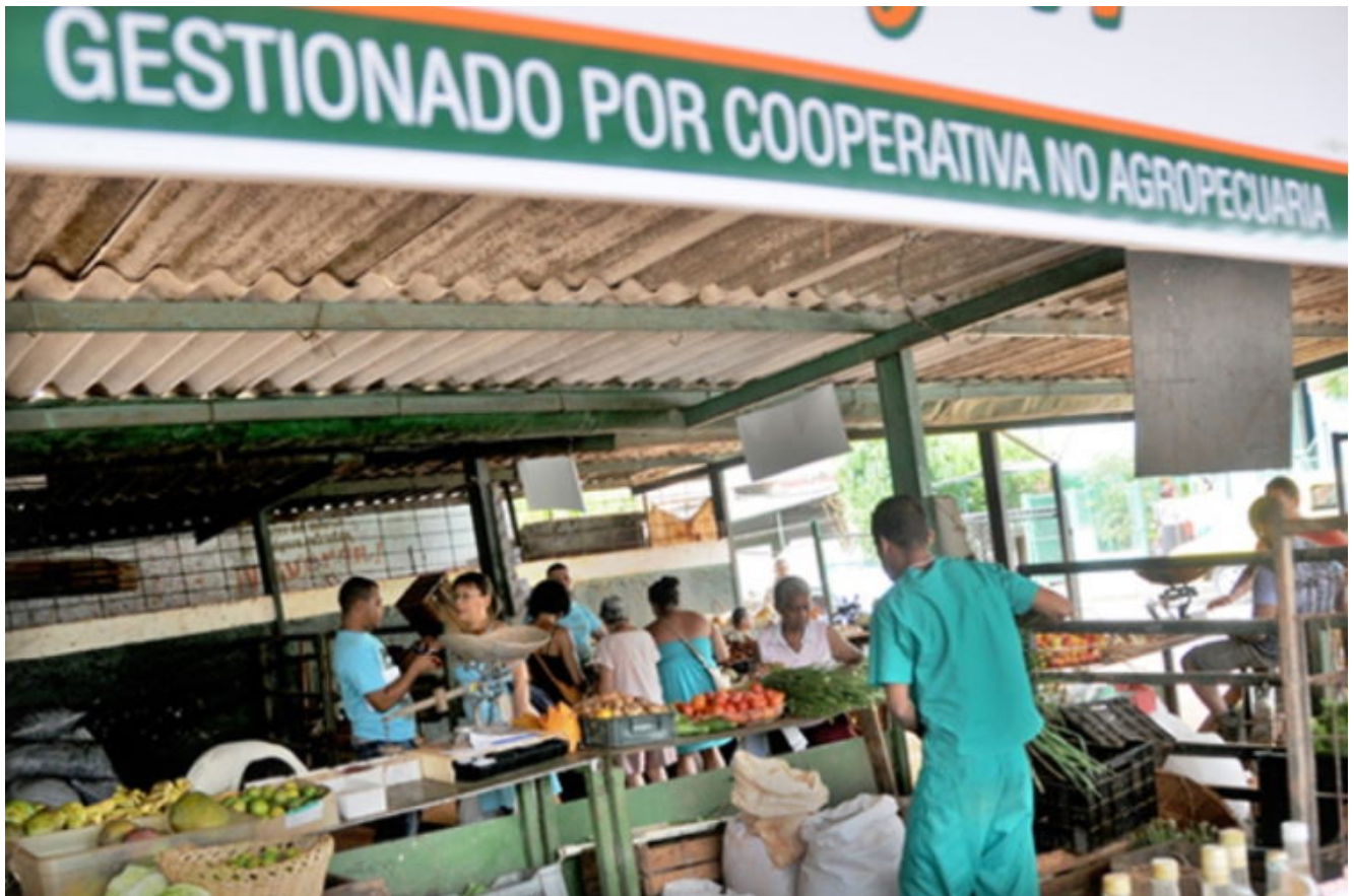
Cooperativa no agropecuaria en La Habana