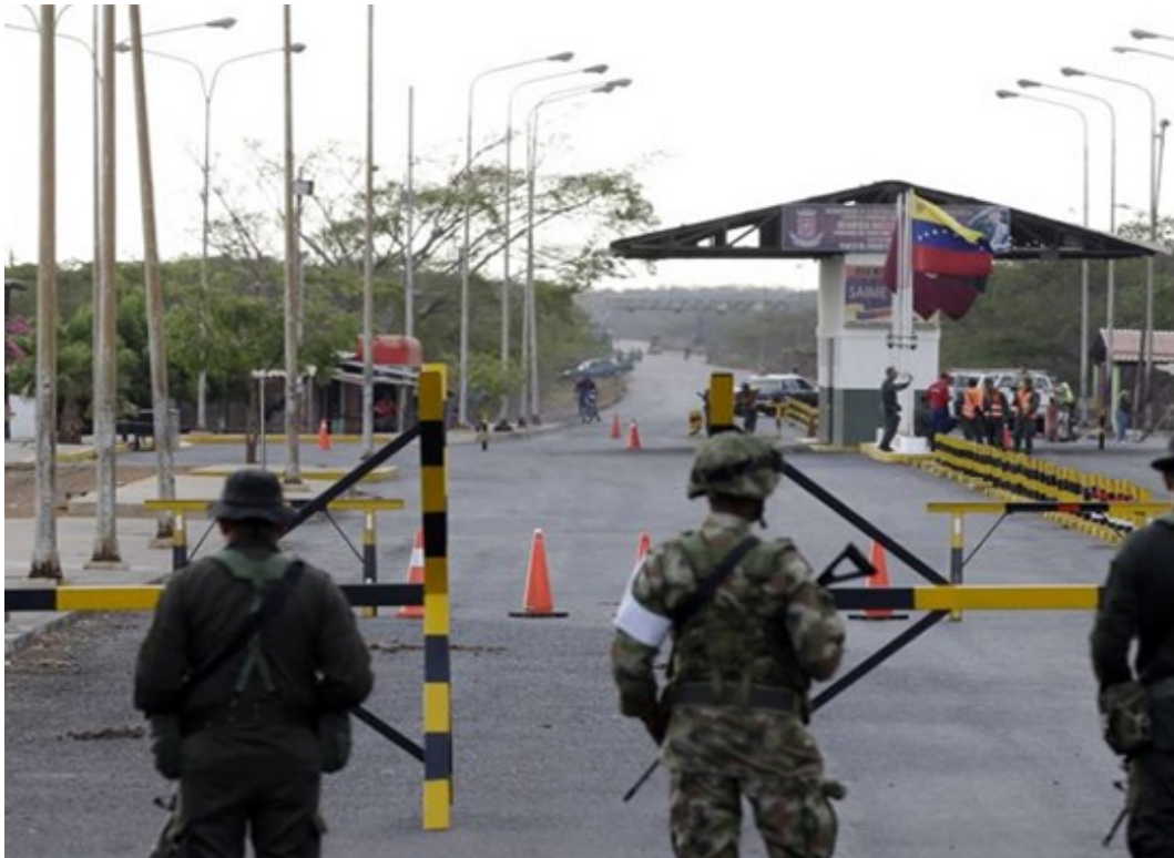
Colombia investiga presunta incursión de Guardia venezolana en su territorio

MIAMI, Estados Unidos.- Las autoridades de Colombia investigan una incursión en su territorio por parte de la Guardia Nacional Bolivariana (GNB, policía militarizada de Venezuela), en el departamento de Norte de Santander (noreste) en una confusa situación que dejó una retroexcavadora inmovilizada y a su operario retenido, informó la agencia de noticias EFE.