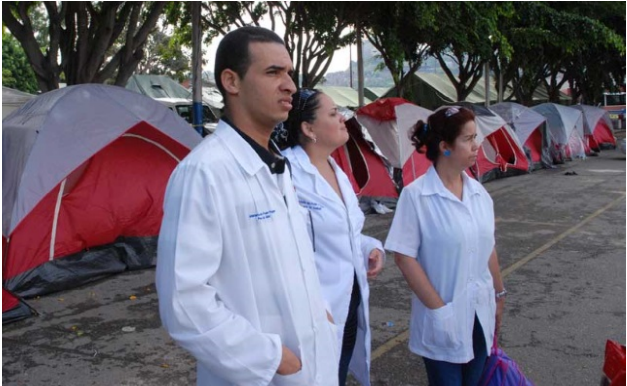
Médicos cubanos podrían volver a trabajar en Brasil.

MIAMI, Estados Unidos.- La propuesta del Congreso brasileño de crear el programa Médicos para Brasil, en sustitución de Mais Médicos, para permitir que los galenos cubanos vuelvan a trabajar en el gigante suramericano, podría ser aprobada por el congreso, según una nota en la página del Congreso de ese país Congresso em Foco .