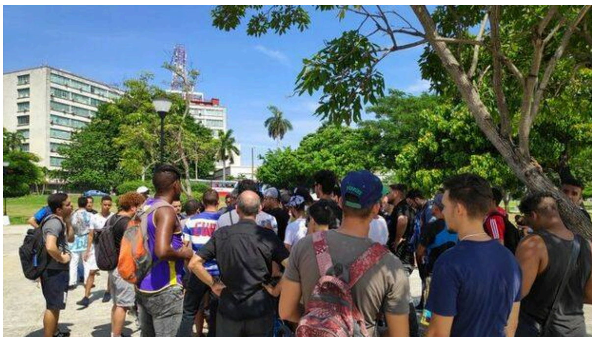
Protesta frente al Mincom en La Habana (archivo)

LA HABANA, Cuba. - La administración general de Snet (la red de la calle) ha convocado a través de las redes sociales a una nueva marcha frente al Ministerio