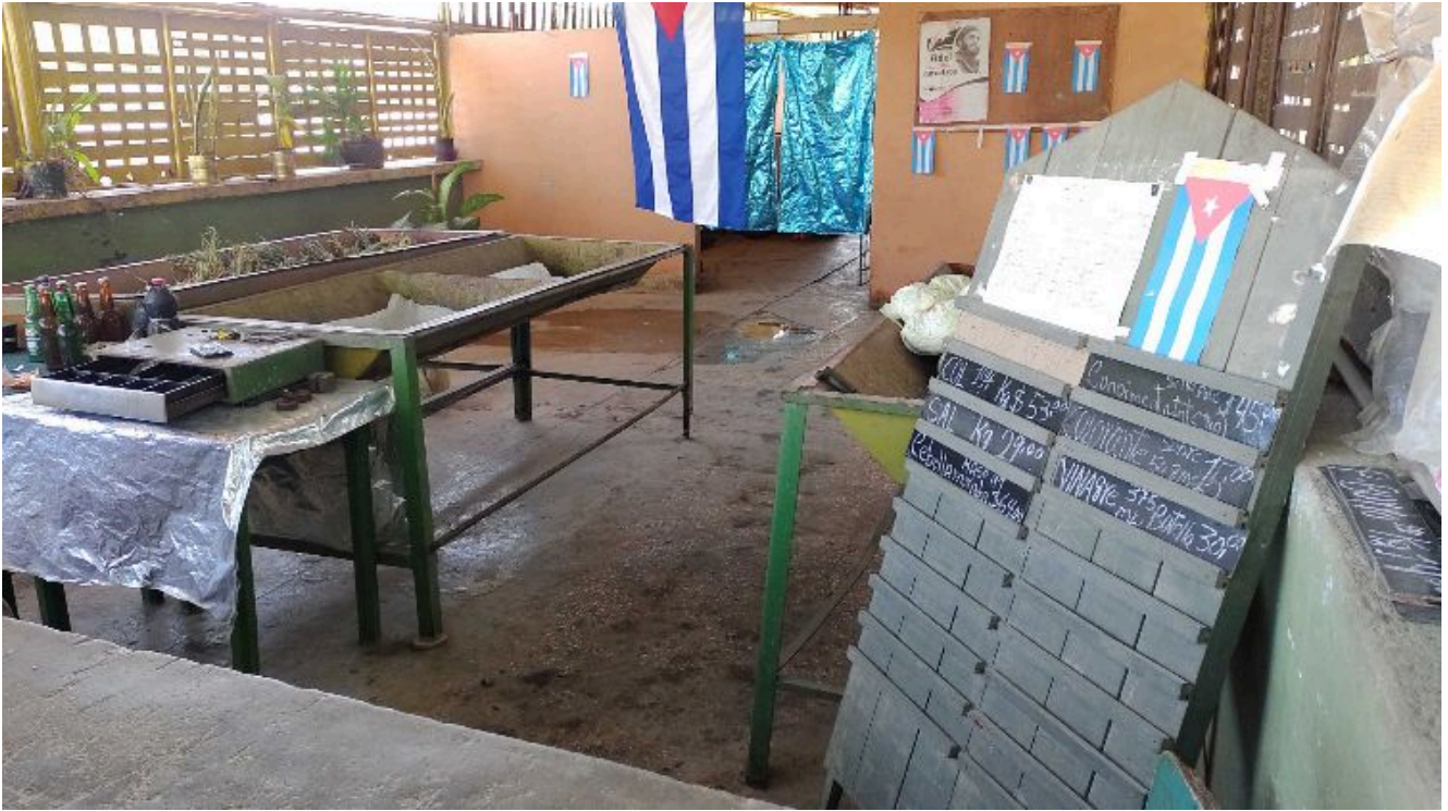
Mercado agropecuario estatal

“El paquete de café con chícharo de la cuota ahora vale cuatro pesos más. El Gobierno sube los precios, pero no sube los salarios ni las pensiones”, acota Medardo.