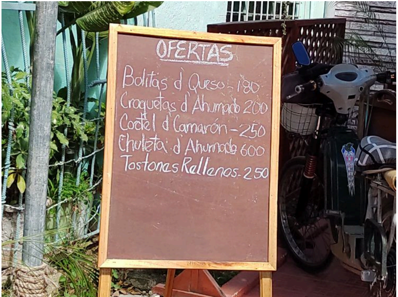
Ofertas de un merendero privado

“Los jubilados somos los que más hambre pasamos en Cuba. Los precios están por las nubes. Nadie puede vivir con las ofertas que nos da el Gobierno”, afirma refiriéndose a la canasta familiar normada que reciben los cubanos mensualmente a través de la cartilla de racionamiento (libreta), la cual incluye siete libras de arroz, un cuarto de litro de aceite, media libra de frijol negro, seis libras de azúcar blanca, tres libras de azúcar parda, 12 onzas de pollo, cinco huevos, 30 bolas de panes de 80 gramos y un paquete de café mezclado con chícharo de 115 gramos, cuyo precio minorista ha subido de ocho a 11 pesos.