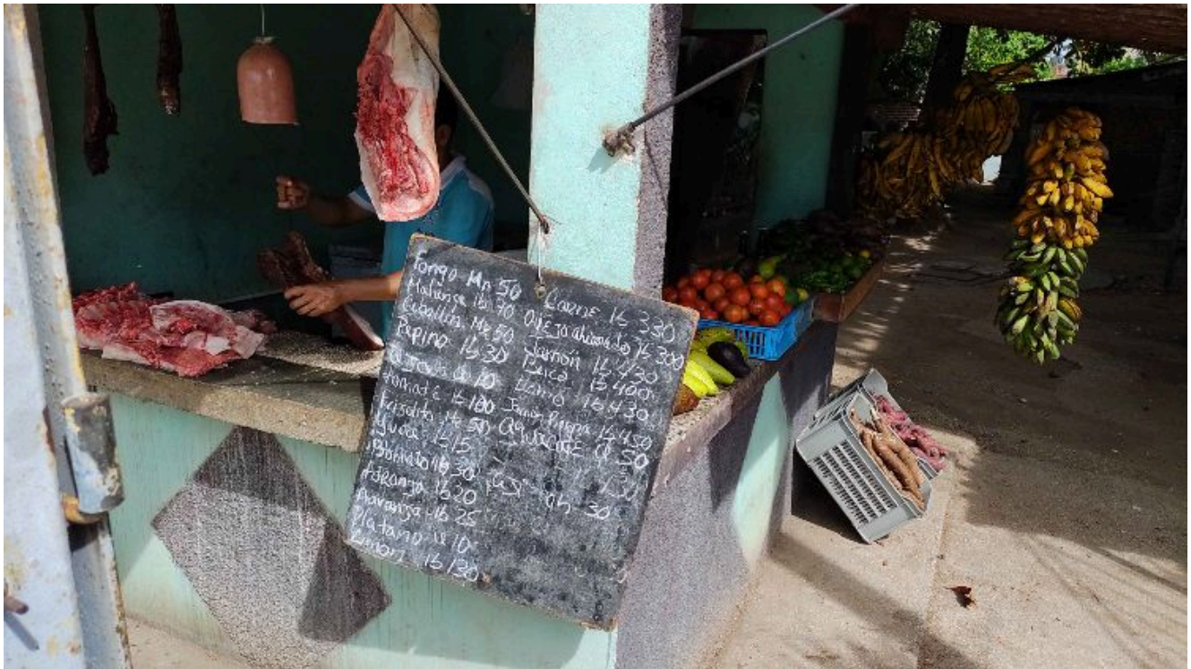
Carnicería y agromercado privados

La escasez de preservativos es una constante en las farmacias cubanas . La crisis, que se intensificó en plena pandemia de COVID-19 (y hasta hoy no se ha resuelto), ha provocado el aumento de enfermedades venéreas, los embarazos no deseados y los abortos. Según un informe del Departamento de Estadística de la Dirección Provincial de Salud de Ciego de Ávila, el déficit de preservativos ha provocado que “las terminaciones voluntarias de embarazos en el primer trimestre del 2022, en comparación con igual lapso del año anterior, crecieran en la mayoría de los municipios de la provincia”.