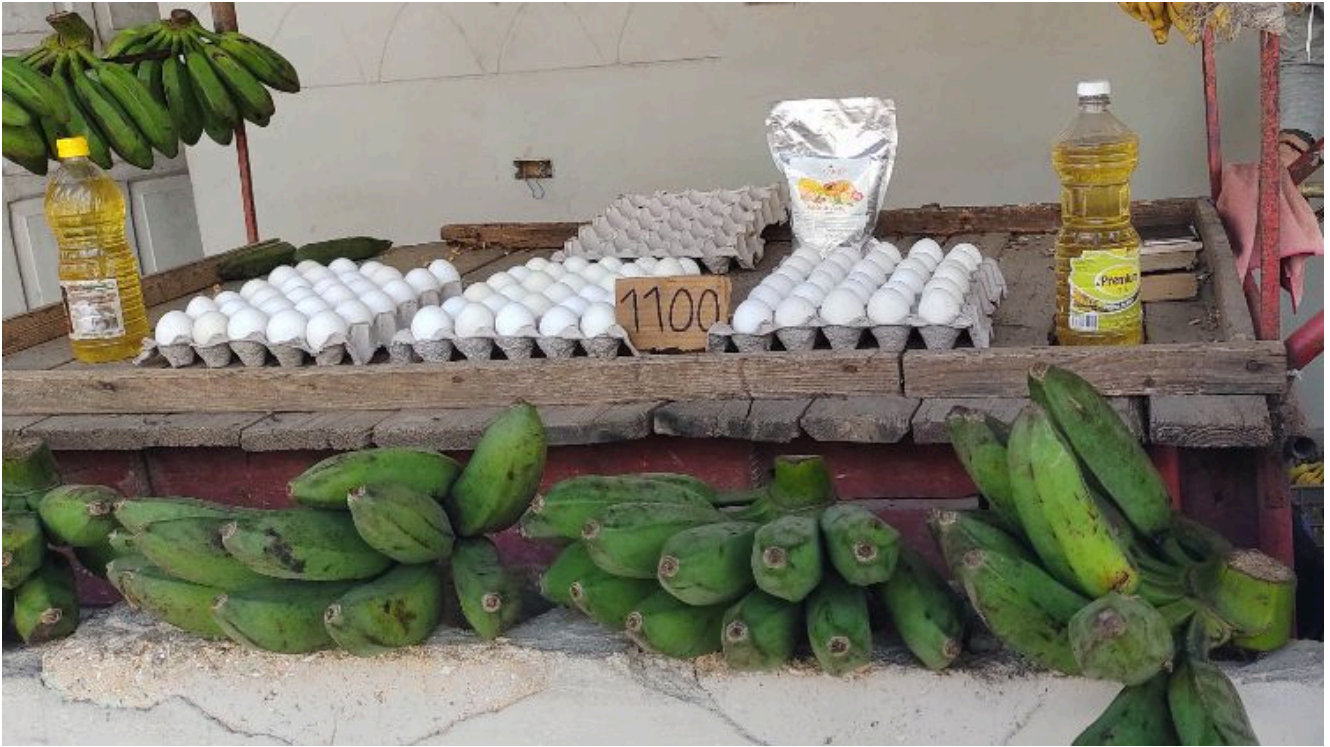
Cartón de huevos a 1100 pesos

En un puesto improvisado en el reparto Hilda Torres cada cartón de 30 huevos cuesta 1100 pesos. En el reparto Pueblo Nuevo no solo han incrementado los precios de los cárnicos; los productos del agro rompen récords: van de 20 pesos la libra de toronja a 130 la de limón.