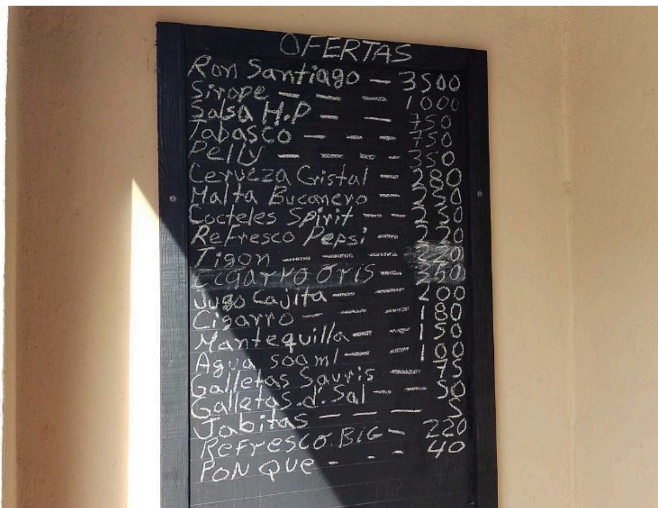
Oferta de un merendero privado en Holguín

Los comercios estatales han dejado de ser un contrapeso en la competencia, y lejos de resolver la situación se han sumado al incremento del costo de la vida, indicador que ubica a Holguín entre las provincias de mayor alza. El café y el picadillo están entre los productos normados estatales con subida de precio. Las tiendas en moneda libremente convertible (MLC) tampoco escapan a esta aciaga realidad.