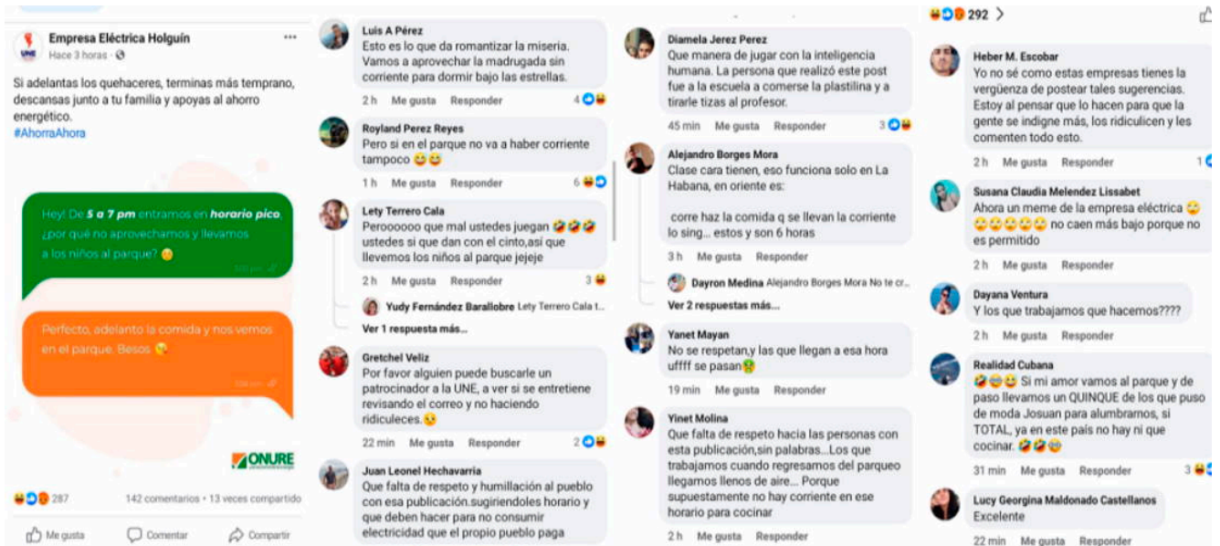
Publicación de la Empresa Eléctrica y comentarios de los usuarios

La elaboración del pan es otras de las actividades vitales afectadas por los cortes prolongados del servicio eléctrico. Los locales de venta del demandado producto han optado por cerrar sus puertas y colgar un cartel donde está escrita la fatídica noticia para sus consumidores.