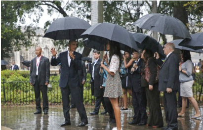
Obama y su familia andan La Habana Vieja