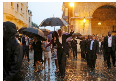
Obama y su familia andan La Habana Vieja