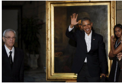
Obama saluda a los presentes en el Palacio de los Capitanes Generales, en La Habana Vieja. A su derecha, el historiador de la ciudad, Eusebio Leal

LA HABANA, Cuba.- El presidente de Estados Unidos, Barack Obama, junto a su esposa Michelle y sus hijas Sasha y Malia, visitaron hoy La Habana Vieja, el centro histórico de la capital de Cuba, un paseo que tuvieron que realizar protegidos por paraguas debido a la lluvia que les ha recibido en la ciudad.