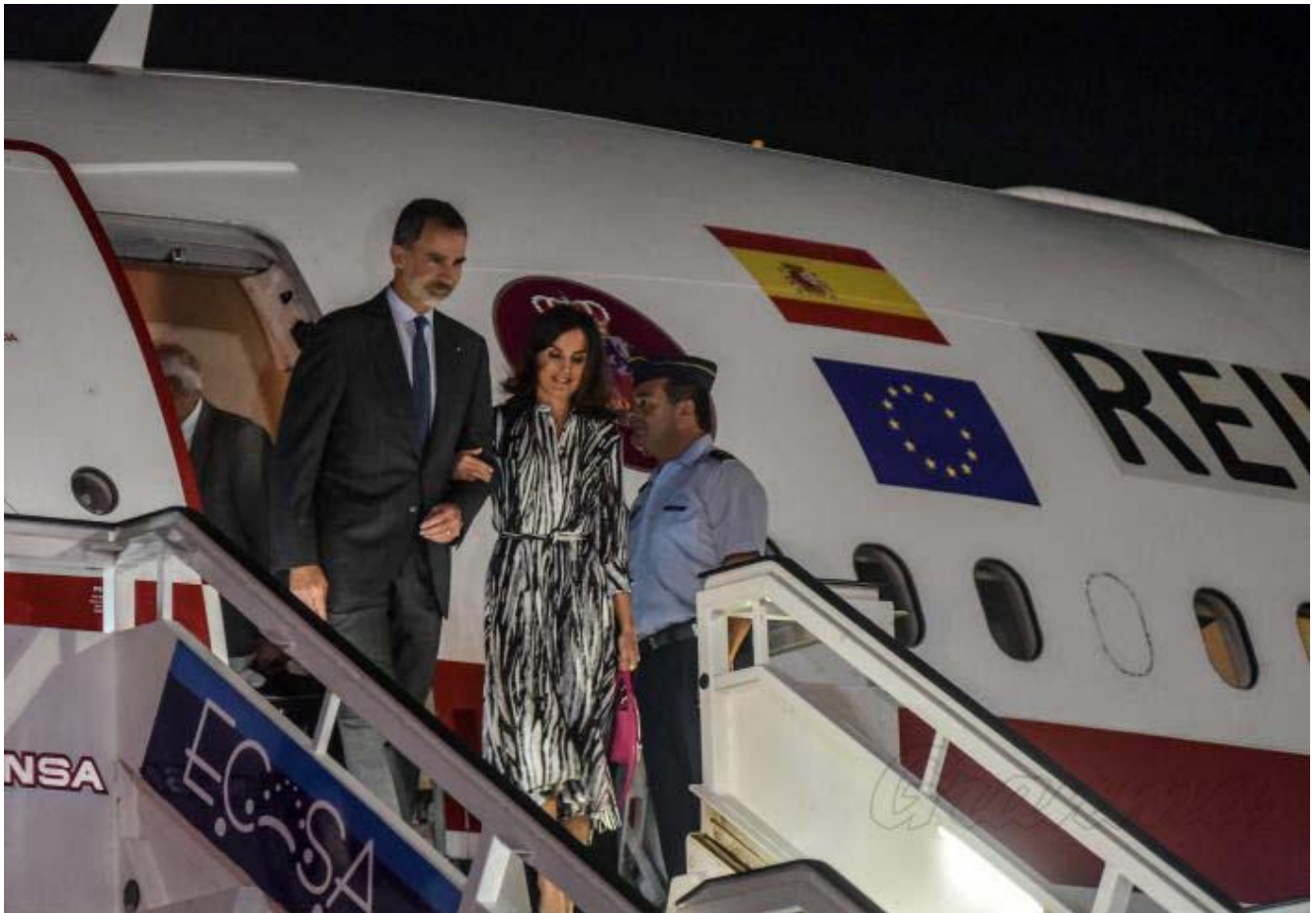
Llegan a Cuba los reyes de España.

LA HABANA, Cuba.- Los reyes de España llegaron este lunes a La Habana para iniciar una visita histórica, la primera de carácter de Estado de un rey español a la isla.