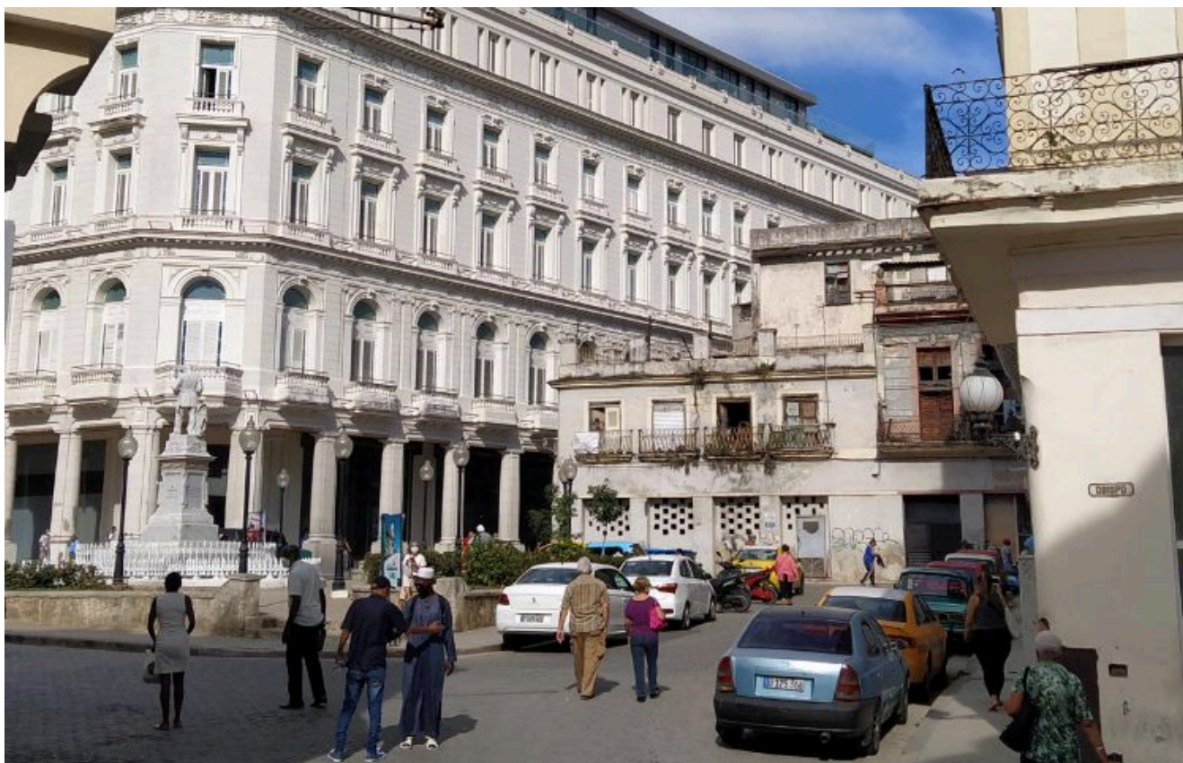
Contraste entre el Hotel Manzana y las viviendas deterioradas del entorno

paralizó (...). Se pensó en el edificio del ISDi por sus potencialidades de ser transformado en hotel, a fin de cuenta esa fue su función original (...). Ha quedado demostrado que el Ministerio de Educación no es capaz de realizar los mantenimientos, que invertir recursos en algo que dentro de cinco o diez años volverá a estar en peligro de derrumbe es absurdo, así que veo muy posible no que termine siendo un hotel pero sí que pase a ser parte de nuestro fondo patrimonial o de la Oficina del Historiador; es de las únicas formas que el edificio se mantendrá en pie”, afirma la fuente.