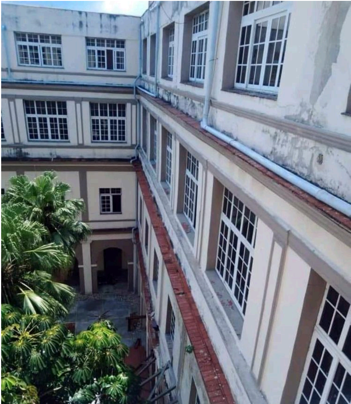
Interior del ISDi

unos más modernos que otros, que son verdaderas joyas de la arquitectura cubana; incluso la Quinta de los Molinos, como espacio de recreo, los edificios de las facultades de Estomatología y Veterinaria”.