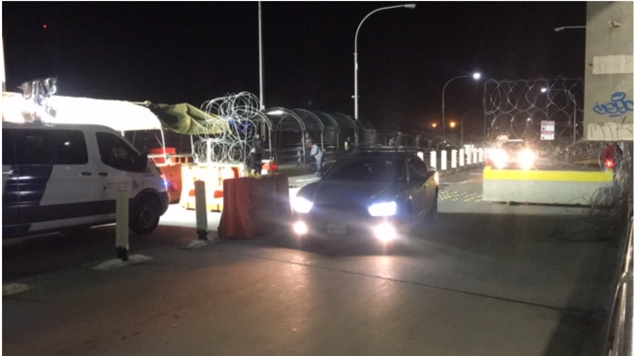
Un vehículo procedente de Ciudad Juárez, México, mientras cruzaba hacia El Paso, Estados Unidos

Las restricciones, al parecer, serán para viajes recreativos y turísticos que realizan las personas mexicanas que viven en la frontera y que poseen una visa láser fronteriza, sin aplicarse para las personas con visados de trabajo ni a la actividad comercial.