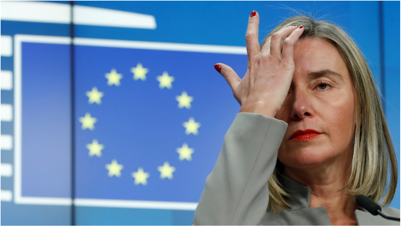
Federica Mogherini

MIAMI, Estados Unidos. – Federica Mogherini, la jefa de la diplomacia europea, llegó a La Habana, para ultimar con quien ha calificado como su amigo, el canciller Bruno Rodríguez Parrilla, el acuerdo que definirá las relaciones entre la Unión Europea y Cuba. Pero llegó en medio de la ola represiva desatada para frustrar la protesta nacional convocada por la UNPACU para el 8 de septiembre.