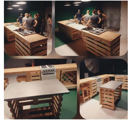
Set/cocina de Sabe a Chef (Captura de pantalla)

Cuba es hoy por hoy un país donde no se produce nada para comer, aunque sí mucho para exportar, y por ahí andan los europeos y los asiáticos comprando las langostas sobre los 40 euros el kilo, mientras que las exóticas angulas las pagan a más de 5.000, por igual cantidad. Pero a la mesa de los cubanos no llega nada, y el legado cultural que alguna vez forjamos en nuestros hogares, como tradición culinaria, españoles, africanos, chinos y aborígenes desde nuestra pobreza e idiosincrasia, seis décadas de empecinamiento político lo han convertido en propiedad y privilegio de unos pocos.