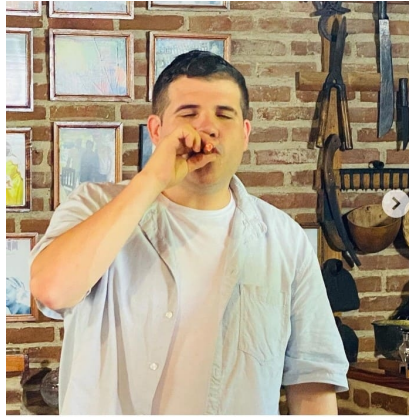
El chef español Miguel Ángel Jiménez (Captura de pantalla)