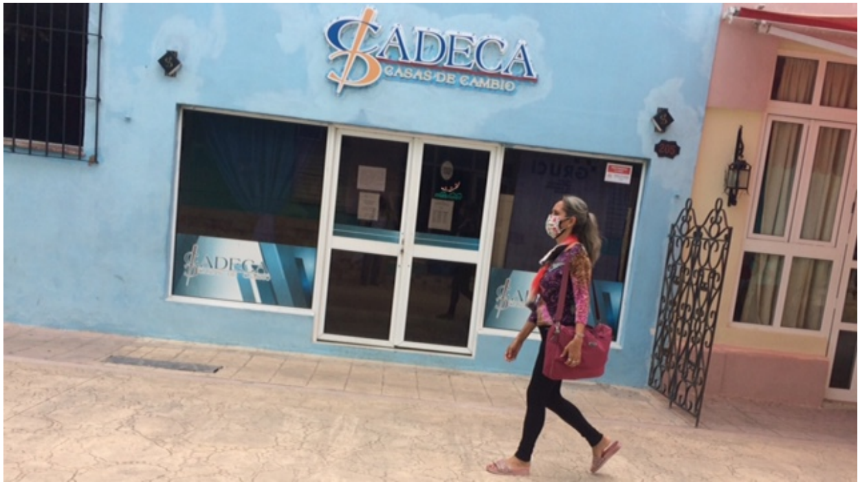
Cadeca sin corriente - Fernando Donate

La oficina de la Dirección Municipal de Trabajo a diario interrumpe su labor por falta de corriente. La situación ha creado malestar a las personas que aguardan para tramitar una licencia de cuentapropista. “He venido en varias ocasiones y no he podido iniciar el trámite porque no hay corriente. Necesito comenzar a trabajar”, comenta Mauricio.