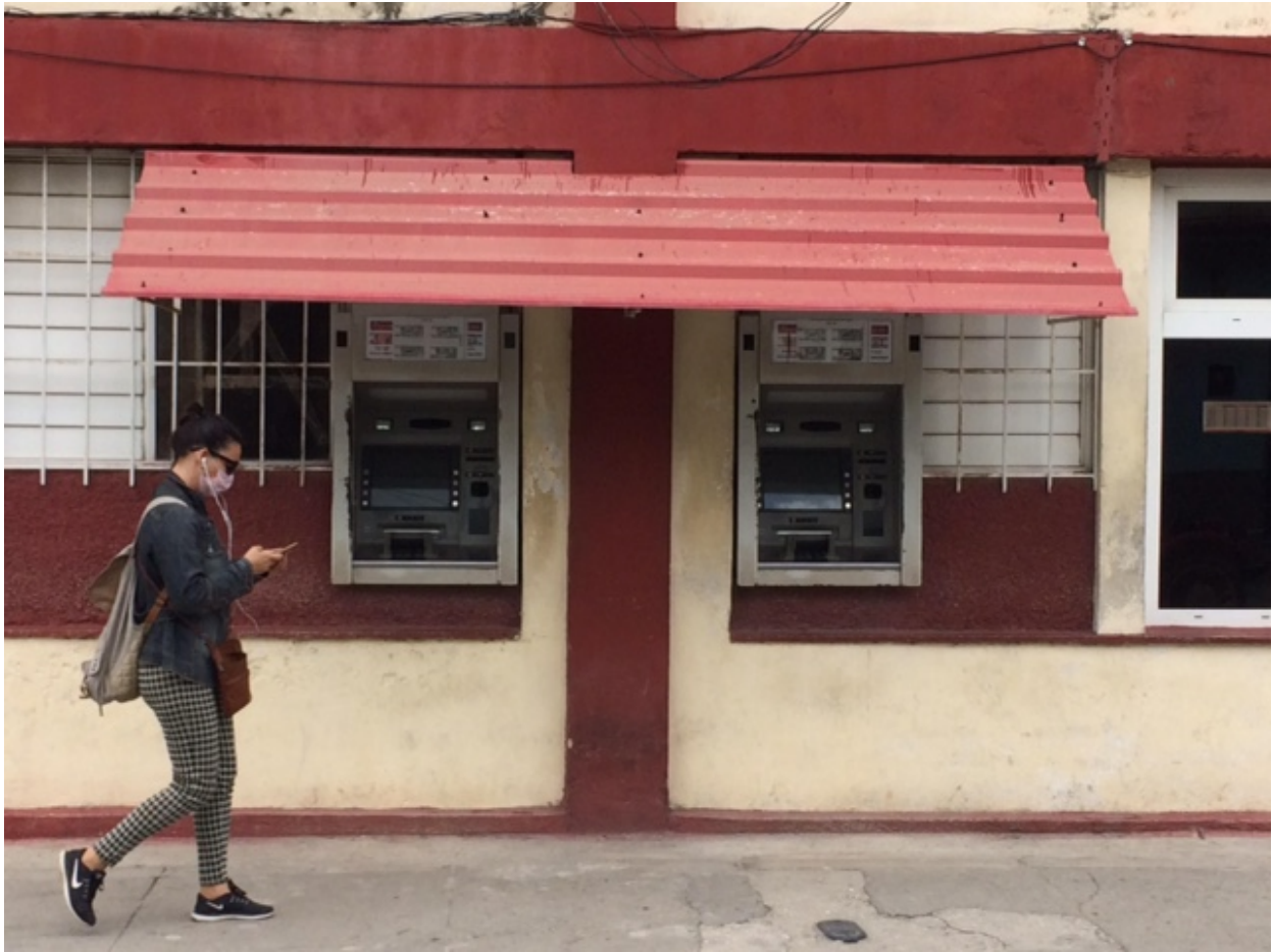
Cajeros automaticos sin corriente - Fernando Donate

En Cuba el 40.6% de la potencia de generación se produce con centrales termoeléctricas, 21.7% con motores a fuel oil, 21.9 % con motores a diésel, casi el 8% se produce con el gas acompañante de la producción de petróleo, 5 % con fuentes renovables de energía (agua, sol y viento) y cerca del 3% restante se produce en las unidades flotantes enclavadas en el Mariel.