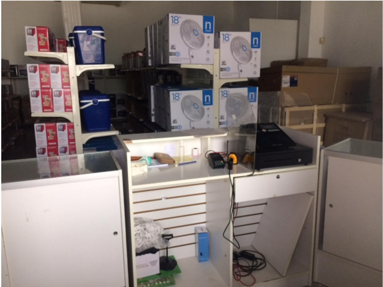
Tienda MLC sin corriente

“La manera que tienes de captar la divisas es vender en MLC para poder reaprovisionar y garantizar un mínimo de oferta en moneda nacional”, así justificaba Alejandro Gil Fernández, viceprimer ministro y titular de Economía y Planificación, la apertura de las tiendas en MLC.