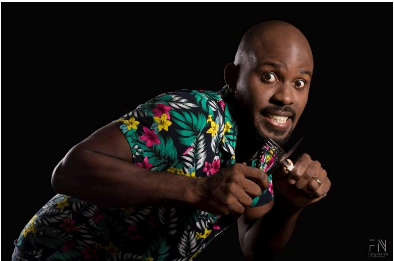
La Crema.

La Crema llegó a la capital a los 18 años y con el dinero de la renta de un par de meses. Quería prosperar, tener otras oportunidades, y eso en el oriente del país parecía lejano. Ese dinero no duró mucho y se quedó en la calle. Tuvo que dejar la música por temporadas y dedicarse a trabajar desarmando computadoras o lo que apareciese, pero sin meterse en líos o cosas ilegales. Vivió en Boyeros, Alamar, Guanabacoa, la Habana Vieja. Saltaba de un alquiler a otro sin perder el foco de la música, que era su meta. Seguía intentándolo sin lograr consolidar su carrera, hasta que de un momento a otro ya no era un cantante anónimo. Pero la fama vino con un precio. Primero, en agosto de 2019 cuando tocaba en Matanzas cortaron “sospechosamente” la electricidad.