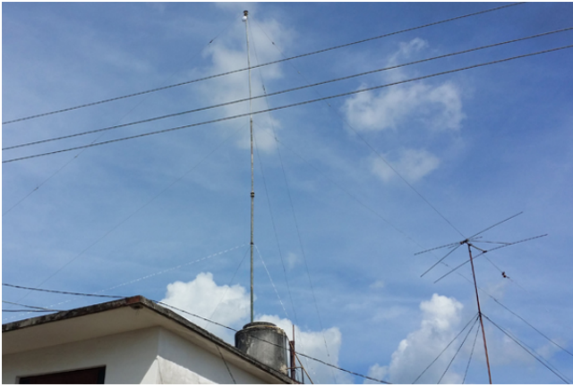
Una antena 'mikrotik' en la provincia Mayabeque